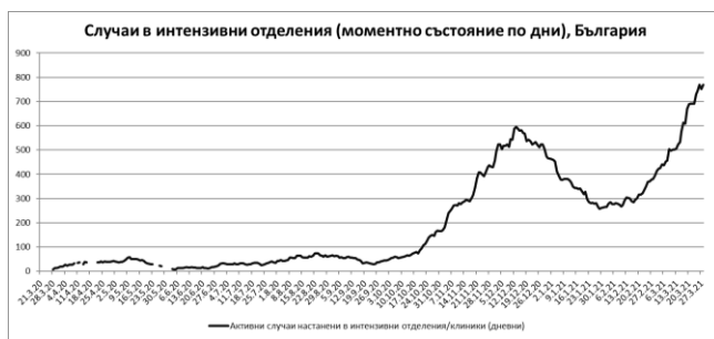
Фиг. 6: Хоспитализирани от COVID-19, настанени в структури за интензивно лечение.

Посочените по-горе данни сочат, че разпространението на COVID-19 в страната е повсеместно, засегнати са всички области на страната и възрастови групи, като към настоящия момент се наблюдава тенденция на задържане на нарастването на броя на новорегистрираните случаи и на техния относителен дял спрямо общия брой изследвани. Натоварена е и здравната мрежа, като от началото на пандемията в страната се отчитат най-високите нива на хоспитализирани лица, вкл. и в интензивни структури. Същевременно благодарение на предприетите мерки готовността на болниците да приемат заболели и да осигуряват адекватно лечение е значително повишена.