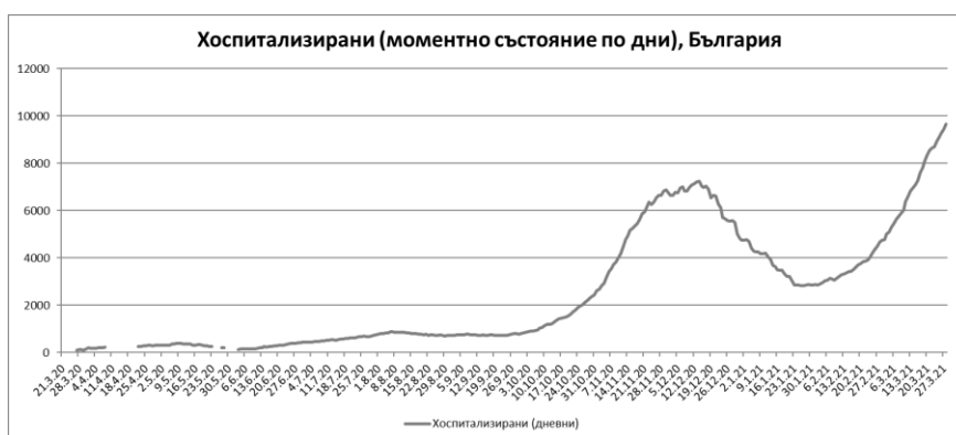
Фиг. 5: Хоспитализирани от COVID-19 в страната.

Наблюдава се отчетлива тенденция за увеличаване при хоспитализираните пациенти с COVID-19, вкл. и на тези, настанени в структури за интензивно лечение, съответно към 28.03.2021 г. 9 674 и 769 лица.