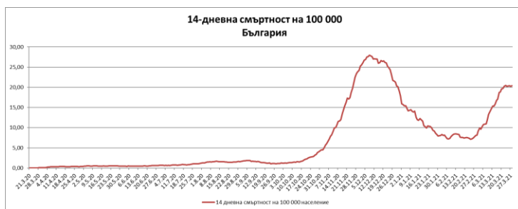
Фиг. 3: 14-дневна смъртност от COVID-19 в България.