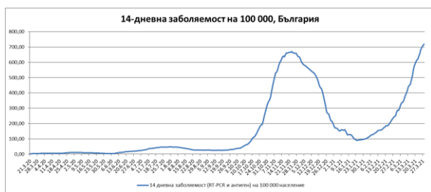
Фиг.1: 14-дневна заболяемост от COVID-19 в България

Регистрираната заболяемост за последния 14-дневен период е 717,72‰ 000 , която е най-високо отчетената от началото на пандемията в страната.