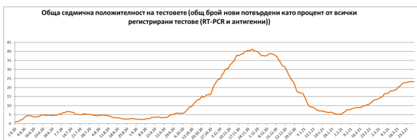
Фиг. 4: Лабораторна диагностика на COVID-19 в страната

След отчетения спад в седмичната положителност на проведените в страната тестове за лабораторна диагностика на COVID-19 (RT-PCR или антигенен тест) през последния месец отново се наблюдава тенденция на нарастване, като за последната седмица се запазва трайно над 22%.