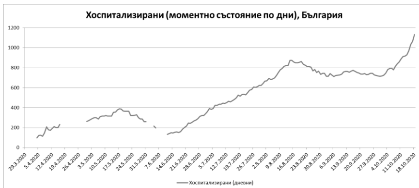
Фиг. 3: Брой на хоспитализираните с COVID-19 в България