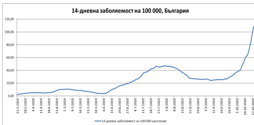
Фиг. 1: 14-дневна заболяемост на 100 000 население, България

на регистрираните случаи на COVID-19, достигане на над 100 заразени на 100 000 население за двуседмичен период (14-дневна заболяемост) – Фиг. 1, нарастване с 1,5 пъти на седмичната положителност на тестовете – Фиг. 2, нарастване на броя на лицата с COVID-19, при които се налага лечение в лечебно заведение за болнична помощ, както и на пациентите, нуждаещи се от интензивни грижи и реанимация, поради влошаване на здравословното им състояние и настъпили усложнение, вследствие на новия коронавирус – Фиг. 3.