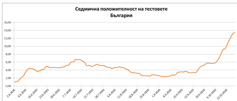
Фиг. 2: Седмична положителност на извършените PCR тестове