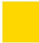
PMS Pantone Yellow