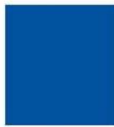
PMS Reflex Blue