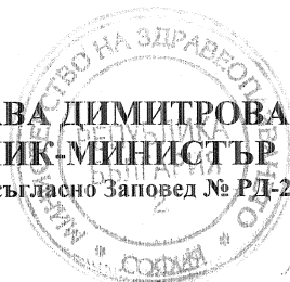
Схема за предоставяне на безвъзмездна финансова помощ BG161 PO001/1.1-08/2010 “Подкрепа за реконструкция, обновяване и оборудване на държавните лечебни и здравни заведения в градските агломерации”

/Възложител, съгласно Заповед № РД-27-31/22.06.2011 г./