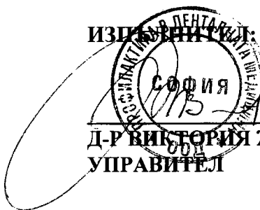
Д-Р ВИКТОРИЯ ЖЕКОВА УПРАВИТЕЛ