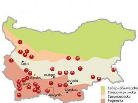
Фиг. 2. Местоположение на обекти от бившата уранодобивна промишленост и количествата останали залежи от уран

Предполага се, че в близост до тези обекти може да се намират сгради с концентрация на радон във въздух по-висока от препоръчаното от СЗО ниво от 300 \text{ Bq/m}^3 за съществуващи сгради. Пасивни (кумулятивни) измервания за продължителен период от време в произволно избрани жилищни сгради са направени от Национален център по радиобиология и радиационна защита – МЗ и СУ „Св. Климент Охридски“ в населените места: с. Елешница, гр. Раковски, Сливен-вилна зона, с. Бачково. Максималната регистрирана стойност е до 4500 \text{ Bq/m}^3 (с. Бачково). Резултатите потвърждават предположението, че съществена част от жилищни сгради в райони с повишен радиационен риск могат да бъдат с концентрация на радон във въздух около или над препоръчителните нива.